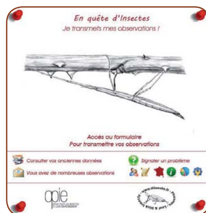
Interface d'accueil du site http://pnaopie.fr/ft/phasmatodea

cation. Essayez de prendre des photos les plus détaillées de ces parties de l'insecte. Si vous reconnaissez l'espèce, cochez la case correspondante sinon « je ne sais pas ! ». Les experts de l'OPIE identifieront l'insecte autant que possible. ■