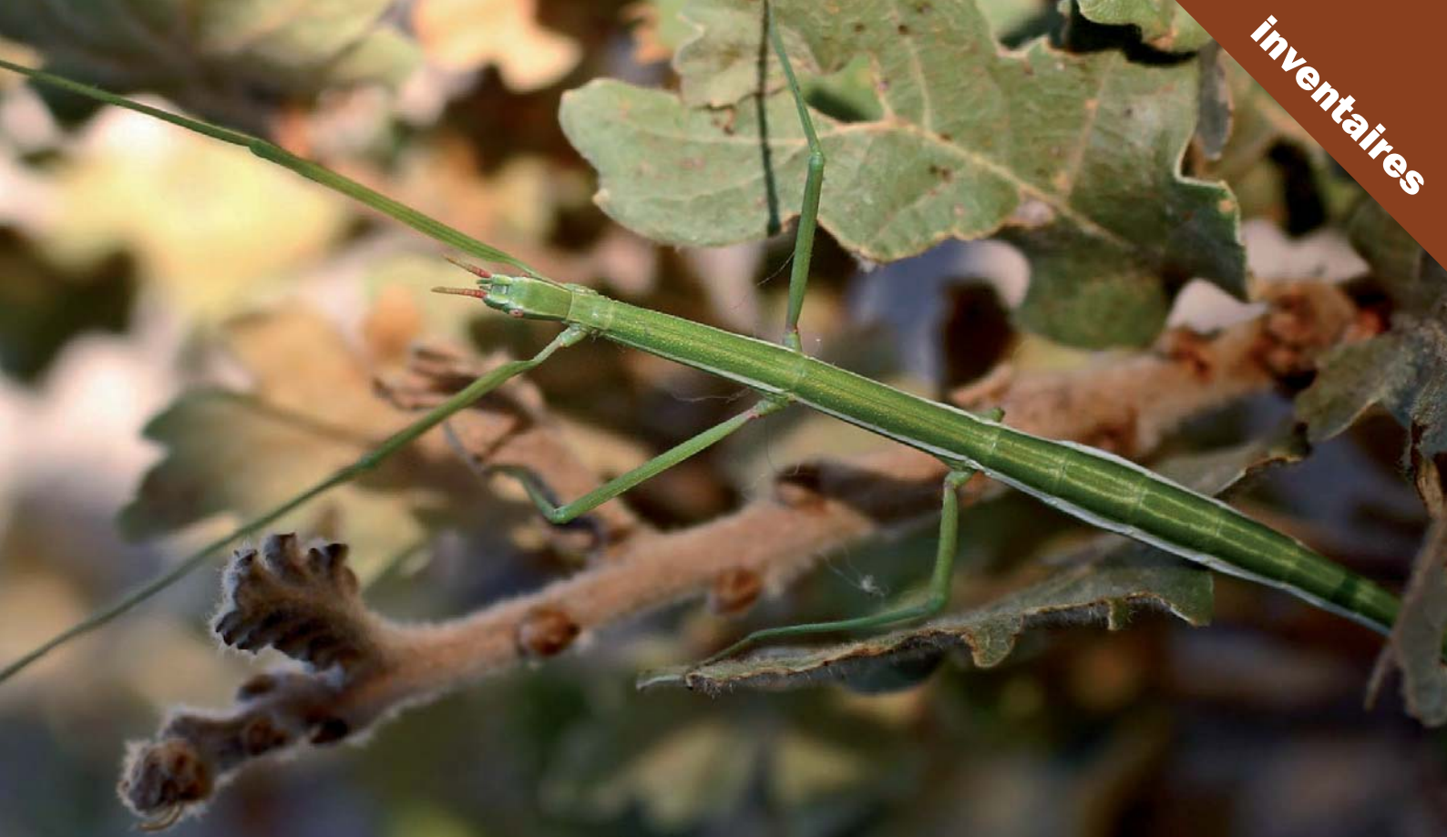
Ci-dessus, Phasme espagnol. Ci-contre, variations de couleur chez trois imagos de Phasme gaulois issus de la même ponte.