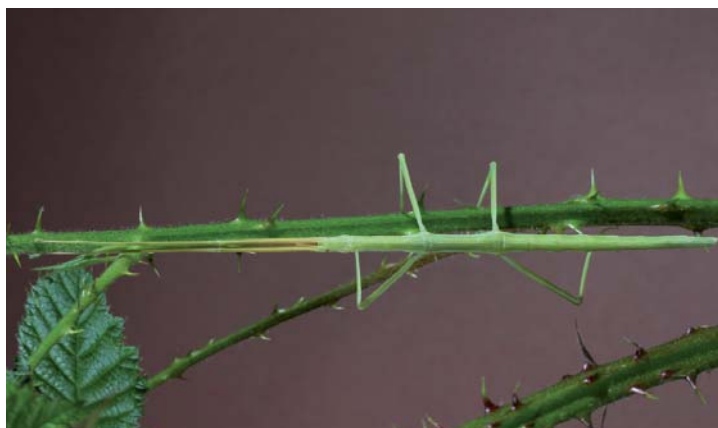
Phasme gaulois