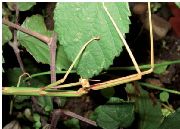
Bacille de Rossi